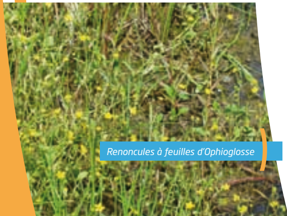
Renoncules à feuilles d'Ophioglosse