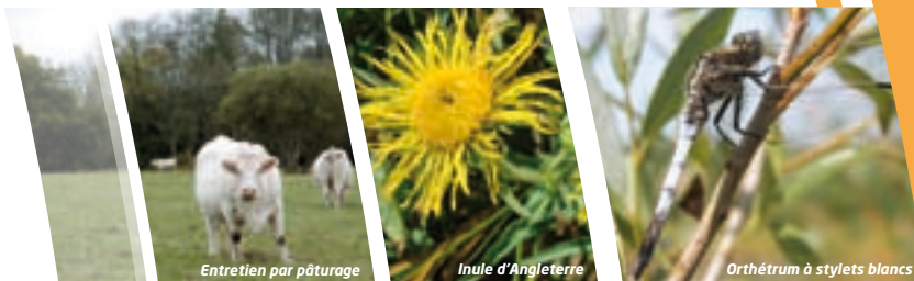
Entretien par pâturage