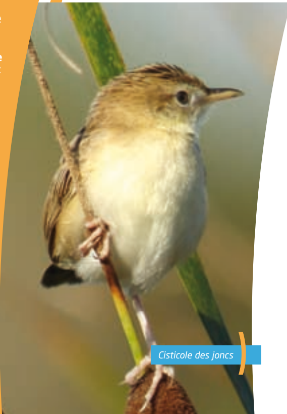
Cisticole des joncs