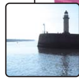
Jetée de la pointe de la Garenne : une agréable balade pour une vue sur l'entrée du port.