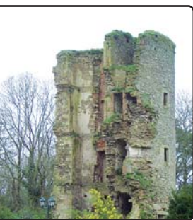
Château de la Garnache Ancienne forteresse du XIe.