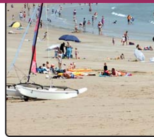
Les grandes plages de Vendée

M Ecomusée de la bourrine du Bois Juquaud