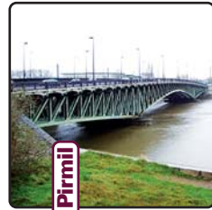
Nantes - Pirmil

Passage sur le Bras de Pirmil, un pont à la "Eiffel"