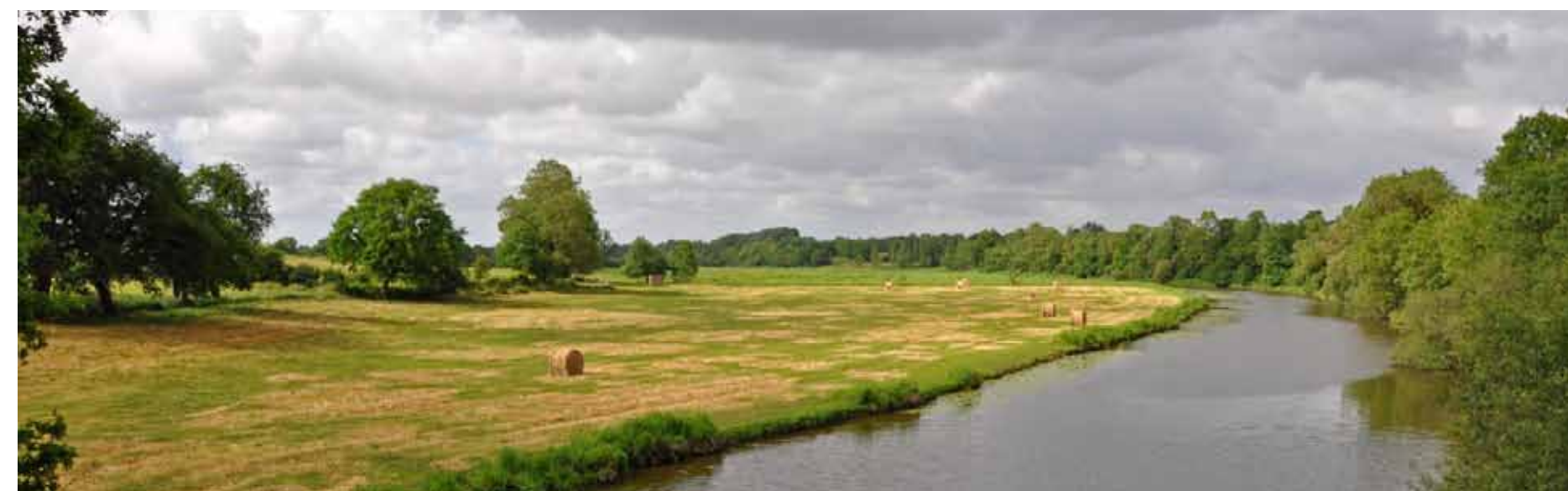
Le bocage rétro-littoral