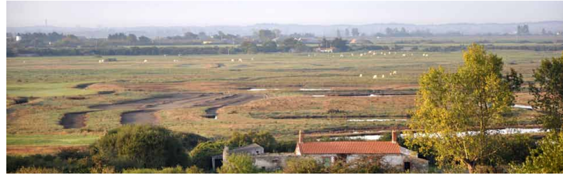
Le marais bretons vendéen