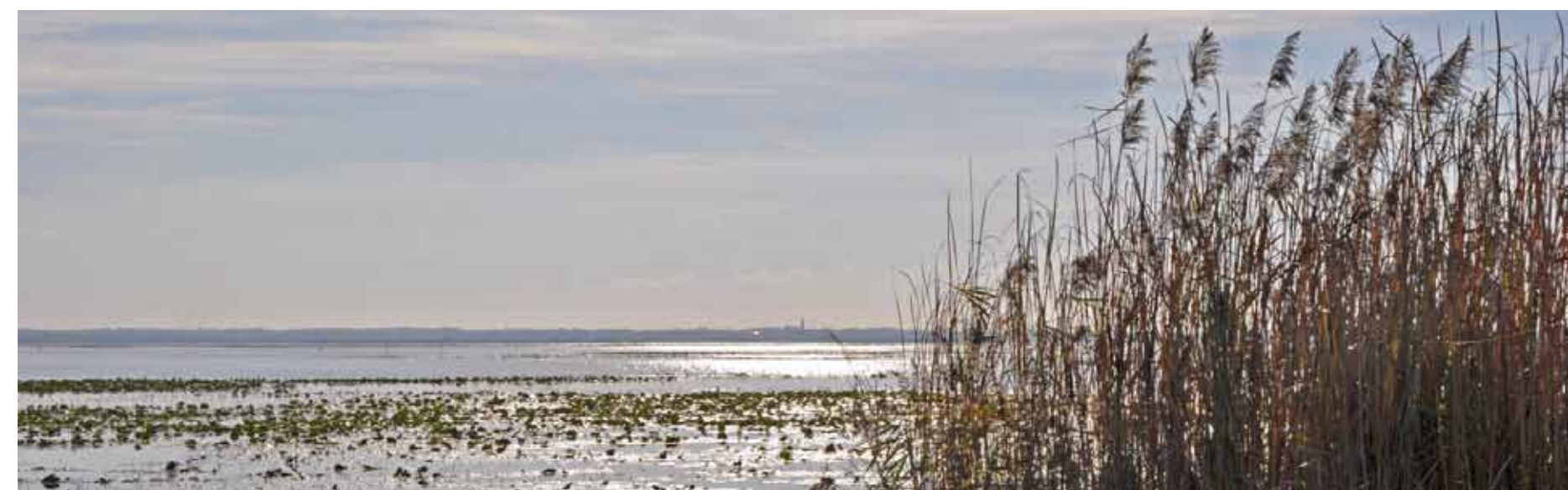
Le bassin de Grandlieu