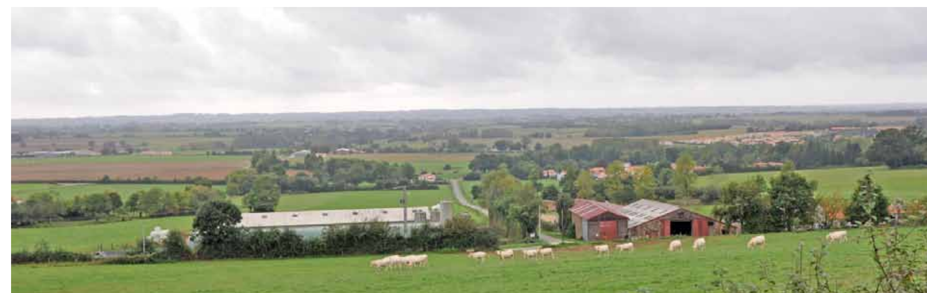
Les marches du Bas - Poitou