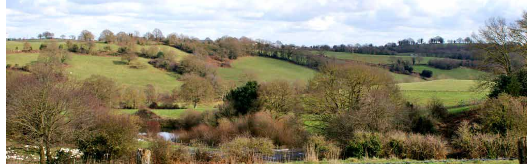
Le haut bocage vendéen