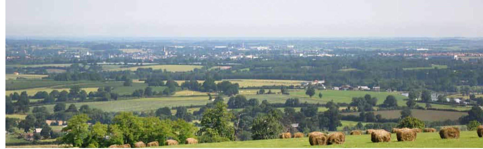
Les bocages vendéens et maugeois