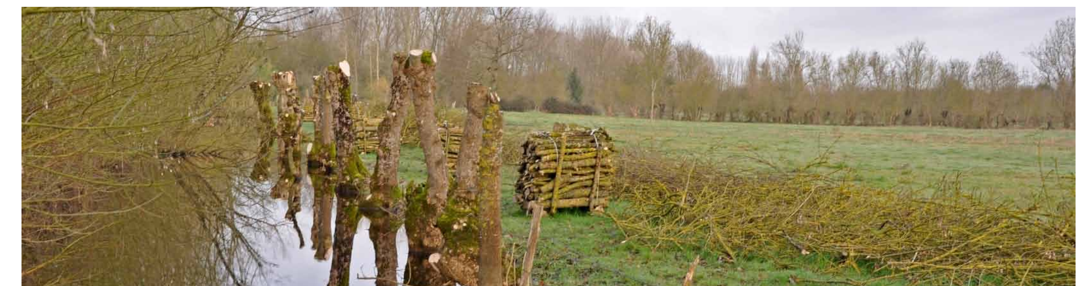
Le marais poitevin