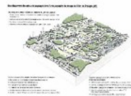
Bloc diagramme pour les enjeux à l'échelle de l'unité paysagère

Les dynamiques paysagères Comparaison des photos aériennes