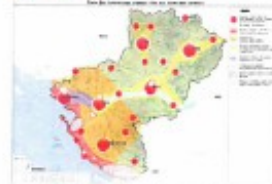
Cartes des dynamiques paysagères (4 dynamiques identifiées)