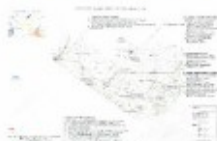
Carte de l'unité paysagère