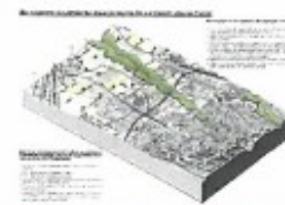
Bloc diagramme légendé pour les 4 enjeux identifiés

Elle rappelle la méthode d'identification et de qualification des 49 unités paysagères de la région.