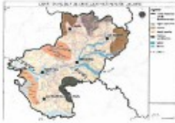
Analyse de la géologie, de la géographie, ...