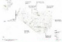
Carte des limites de l'unité paysagère