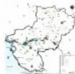
Carte des représentations de paysage